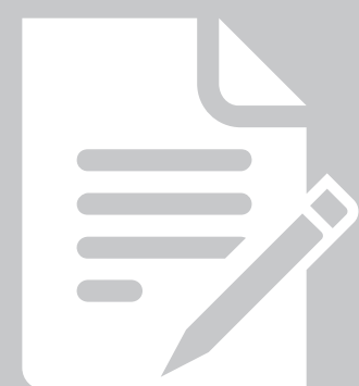
moduł kontroli zużycia paliwa