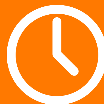
alerter czasu pracy